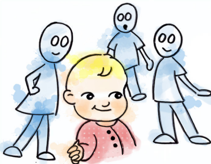
Falta de ansiedad ante extraños