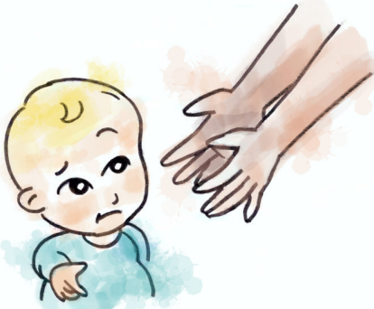
No muestra anticipación cuando se le va a coger en brazos