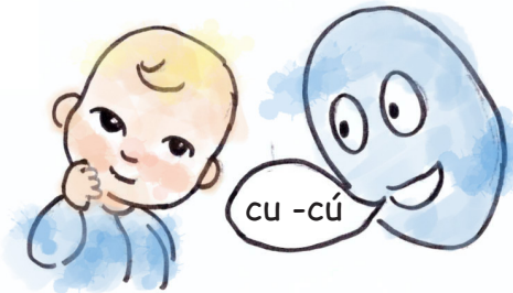
Falta de interés en juegos interactivos simples