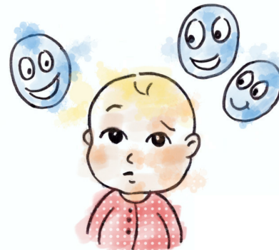
Falta de ansiedad ante extraños