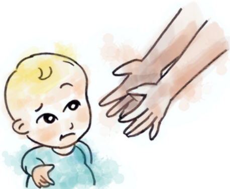
No muestra anticipación cuando se le va a coger en brazos