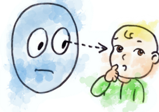
Escaso contacto ocular